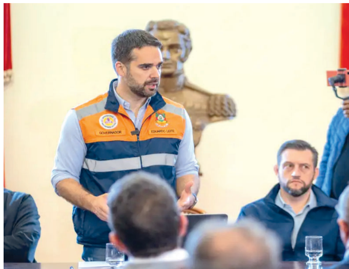
EDUARDO LEITE divulgou previsão bilionária para recuperar destruição no território gaúcho; quase 1,5 milhão de pessoas foram afetadas

A quantia é resultado de uma ação perdida contra jornalistas da Abril Comunicações no ano de 2018, ficando o político com o encargo de pagar os honorários dos advogados que re-