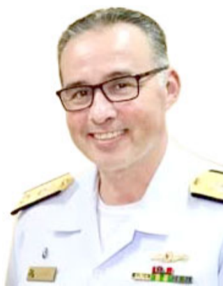
Antonio Carlos Cambra

O presidente da Assembleia Legislativa da Bahia, Adolfo Menezes (PSD), homenageou o comandante do 2º Distrito Naval, vice-almirante Antonio Carlos Cambra, com o título honorífico de Cidadão Baiano. A solenidade, na tarde de ontem, foi no plenário da Casa. "A concessão do Título de Cidadão Baiano Honorário ao vice-almirante Cambra é uma homenagem de inteira justiça a um brilhante militar da Marinha do Brasil", afirmou Adolfo Menezes.