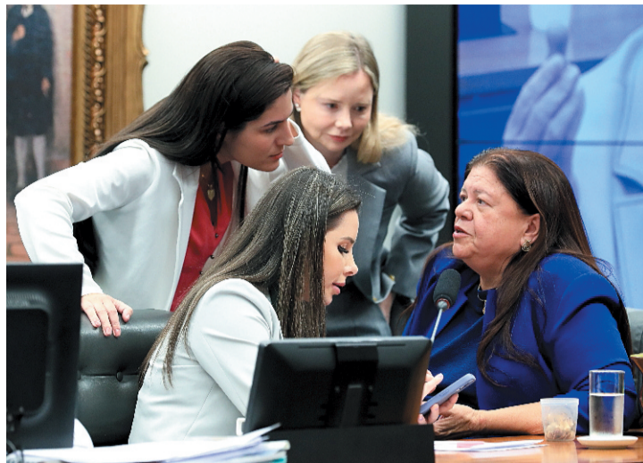
Com aprovação da PEC na CCJ, será criada uma comissão especial

“Sempre permitimos a entrada de manifestantes nessa comissão, desde que sejam feitas de maneira respeitosa e silenciosa, mas essa manifestação foi desrespeitosa”, afirmou a presidente da CCJ.