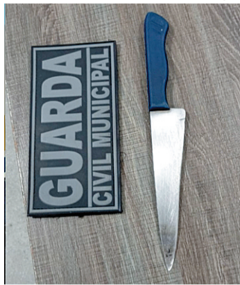
Arma estava dentro da mochila