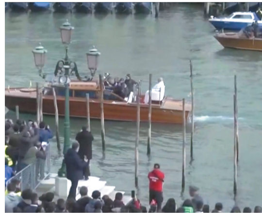
Papa passeou de barco pelo canais venezianos