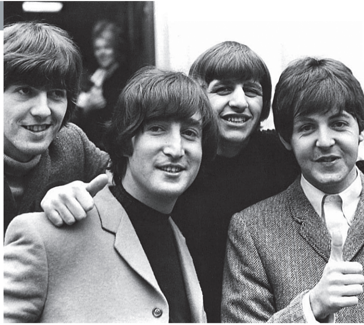
Now and Then ainda ganhará um clipe que será disponibilizado no dia 3

A canção tem gerado expectativas desde que Paul deu mais detalhes e afirmou que a voz de John Lennon foi recuperada com o uso de inteligência artificial (IA). Ela, porém, não foi recriada, como tem sido feito recentemente com a voz de vários