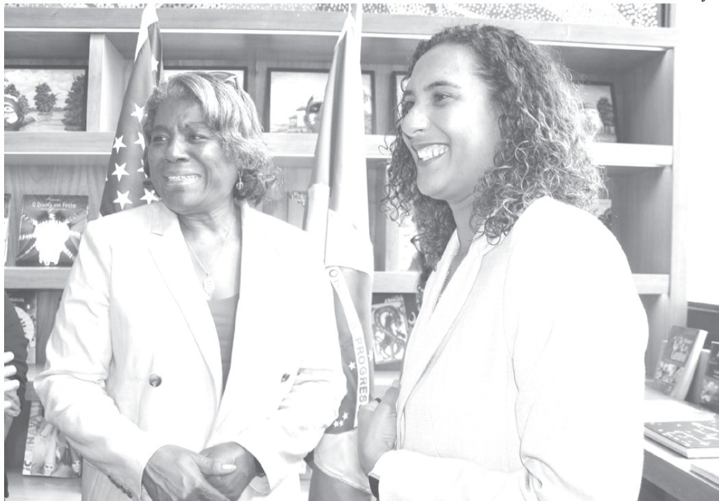
ENCONTRO Embaixadora dos EUA Linda Thomas-Greenfield e a ministra Anielle Franco participaram de evento

Além desses, também estão inclusos no programa o treinamento profissional para mulheres afrodescendentes na mídia e no jornalismo comunitário no Brasil e o reconhecimento de iniciativas que promovem a inclusão social e equidade racial, como um curso de Podcast para comunidades quilombolas e bolsas de estu-