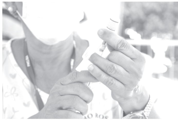
IMUNIZAÇÃO Vacinação é a forma mais eficaz de prevenir a Covid

Ainda de acordo com a SMS, a variante está sendo monitorada pela OMS como uma variante de interesse, que até o momento não apresentou gravidade ou